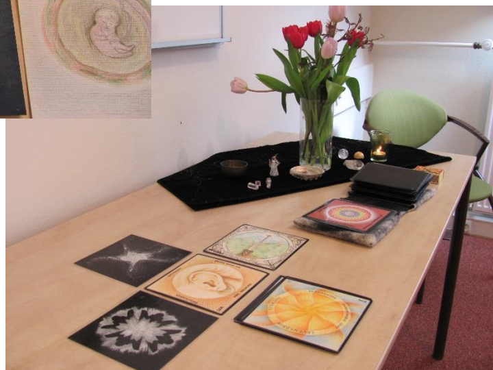
Uitleg leren geven