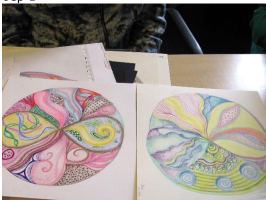
Chakra & Biografie