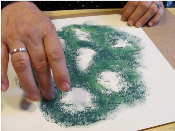
2 de Gevorderdendenjaar oefeningen Hartchakra

VOOR VROUWEN DIE EEN NIEUWE START WILLEN MAKEN IN VERBINDING MET ZICHZELF