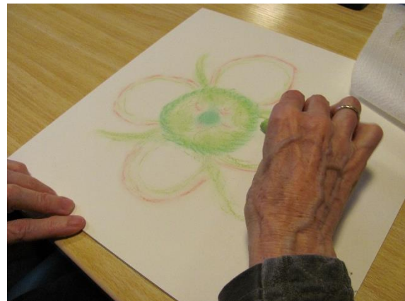
3 de Docentenjaar