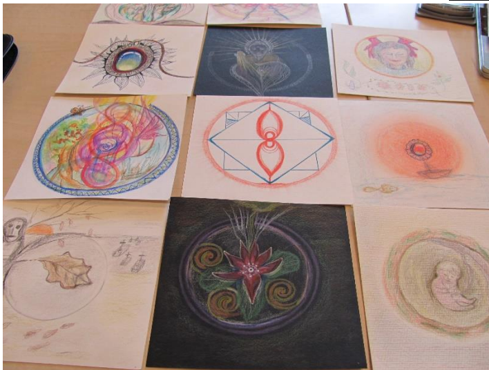
Tekenen van het eigen unieke kaartspel